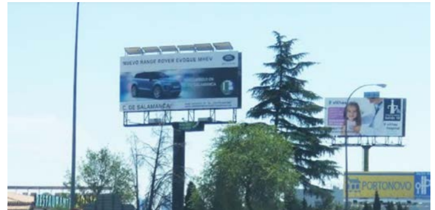
Ejemplos de campañas realizadas por Agaral: producción e instalación de monoposte en la Autovía A6.

publicitarias en prensa escrita y digital, local y nacional, revistas, emisoras de radio, cines y televisiones. Aconseja sobre los diferentes formatos existentes para anunciarse en la radio (desde las menciones y los patrocinios, a las cuñas y participación en microespacios...). Aborda también la planificación, la creatividad y la producción de un spot en televisión o cine. En el ámbito de la PUBLICIDAD EXTERIOR, diseña e instala anuncios en pantallas de centros comerciales, monopostes, vallas, mupis, marquesinas... que se pueden ver en las paradas e instalaciones del autobús, del metro, del aeropuerto... Pueden realizar lonas de gran formato. Agaral cuenta con un equipo de DISEÑADORES de larga trayectoria, con experiencia y ofrece un servicio integral de IMPRESIÓN de primera calidad. Las empresas pueden encargarse folletos, catálogos, flyer, tarjetas de visita, carpetas