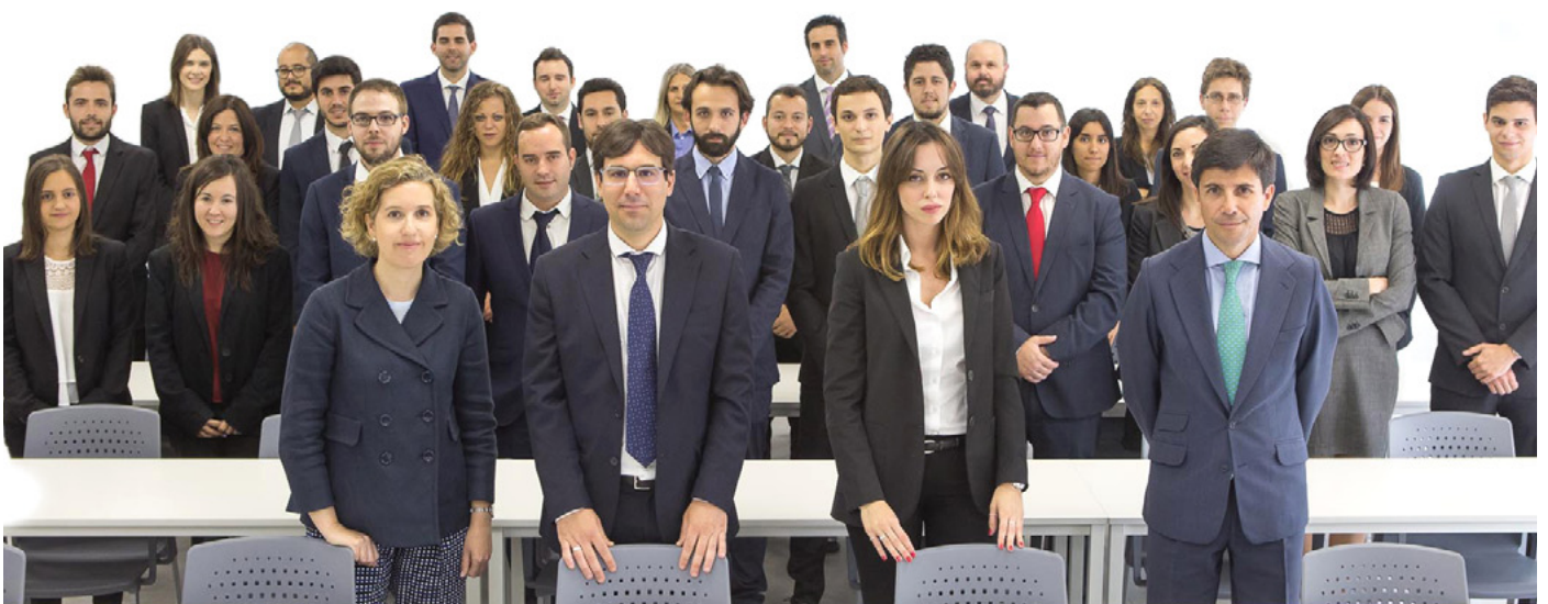
Equipo de profesionales de Biconsulting.